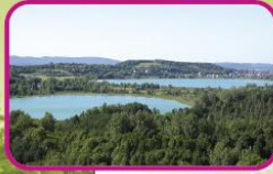
Lac de Chalain